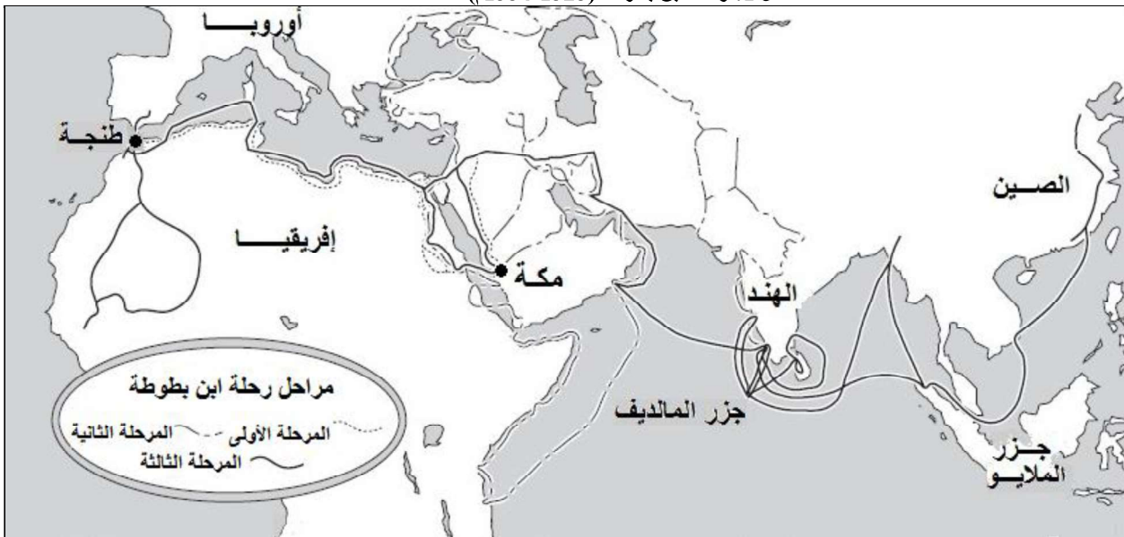
شكل 1: رحلة ابن بطوطة (1325-1354م)