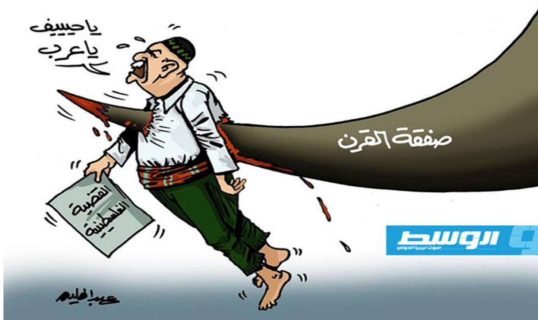
شكل رقم (1)

المحور الثاني: نتائج التحليل السيميائي لرسوم الكاريكاتير عينة الدراسة